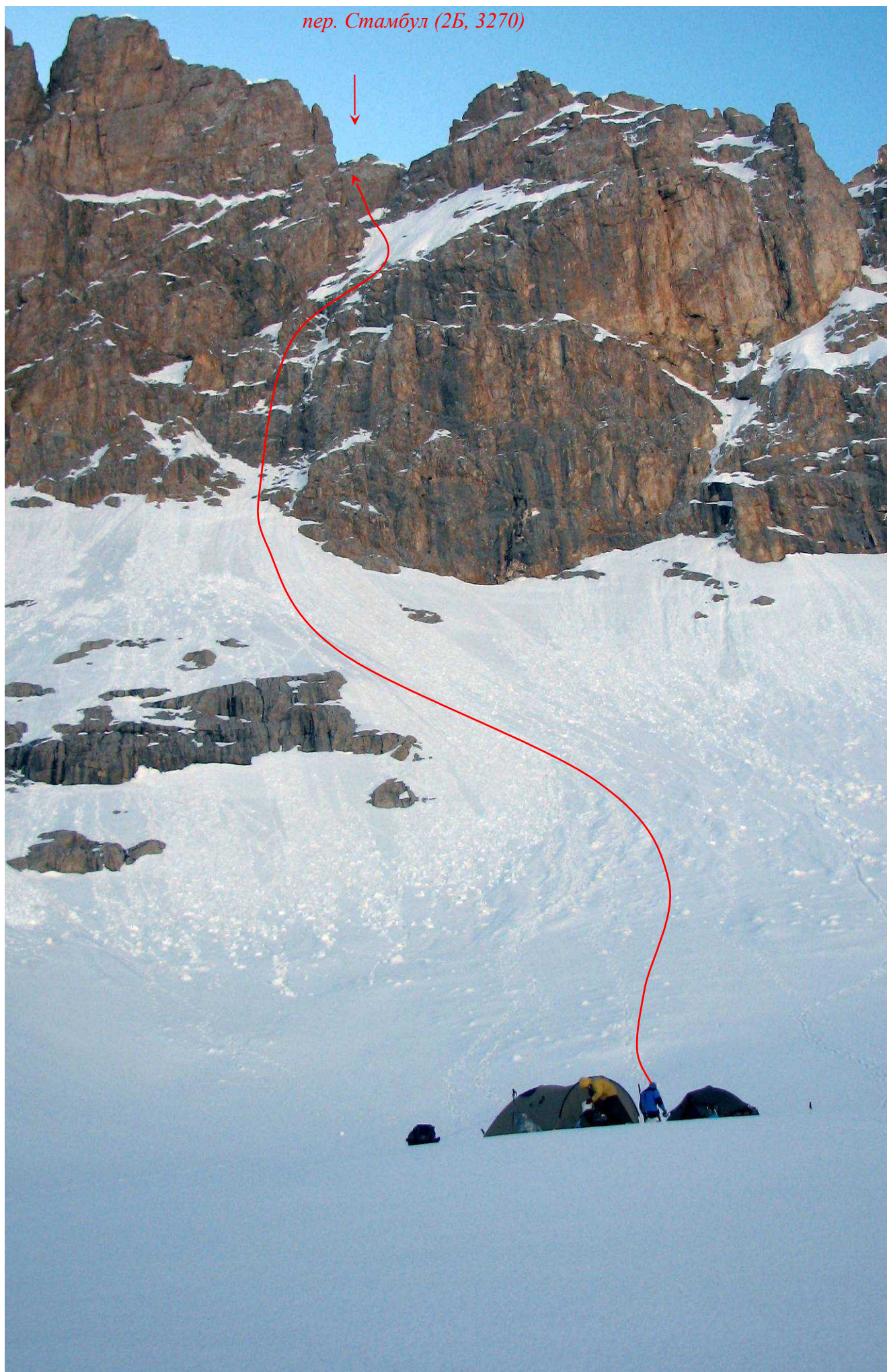
Фото 63. Перевал Стамбул (2Б).