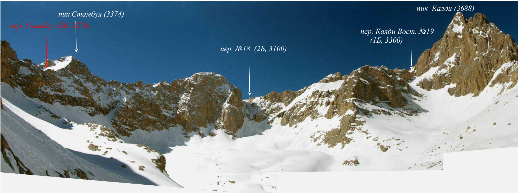
Фото 60. Верховья южной ветки долины Сырма.