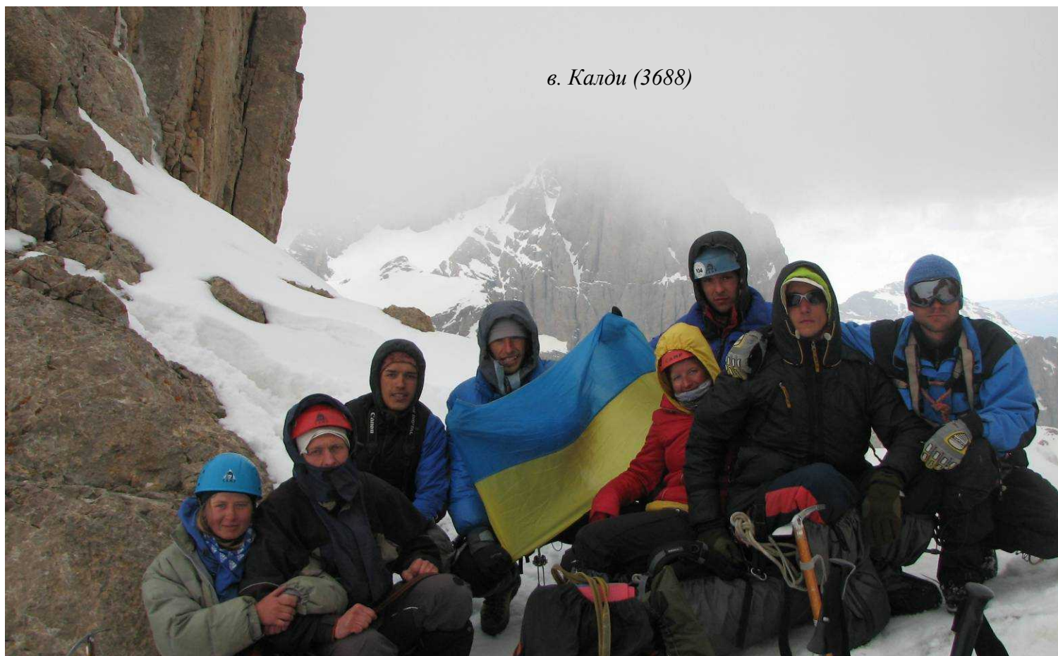
Фото 73. Группа на перевале Стамбул (2Б).