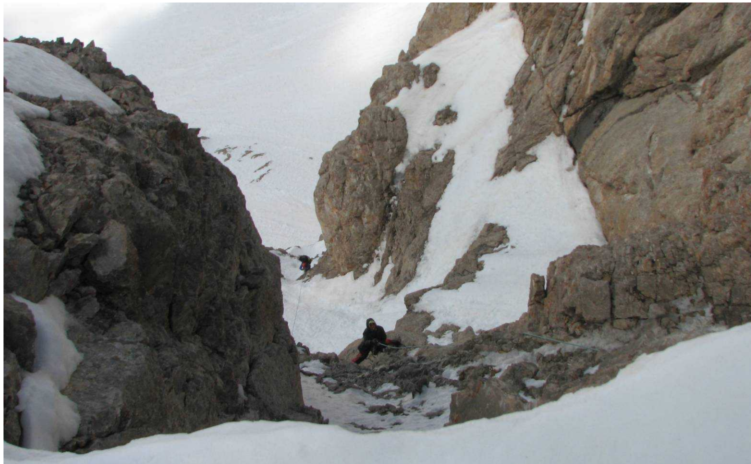
Фото 71. Подъем на перевал Стамбул (2Б). Прохождение четвертой и пятой веревок.