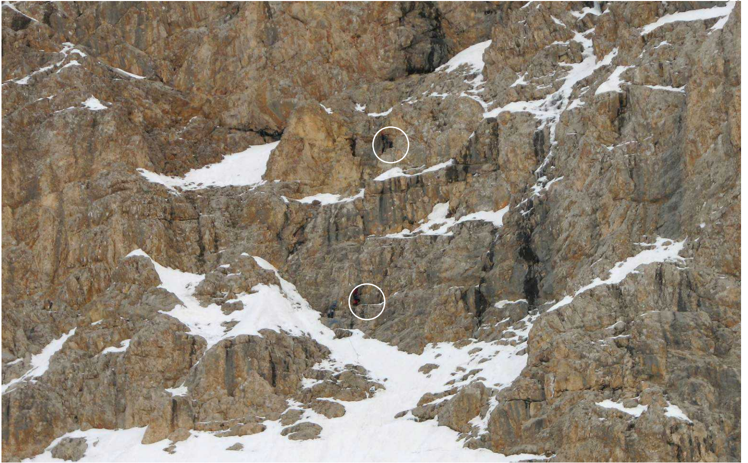
Фото 66. “Обработка” перевалу Стамбул (2Б). Третья веревка, зум 10X.