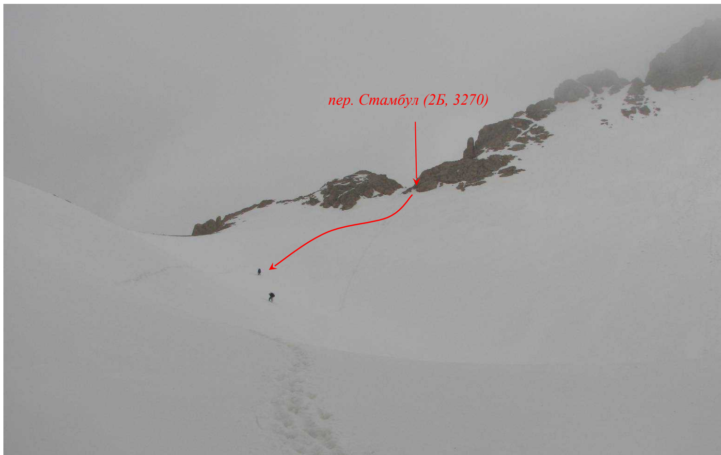
Фото 74. Спуск с перевалу Стамбул (2Б).