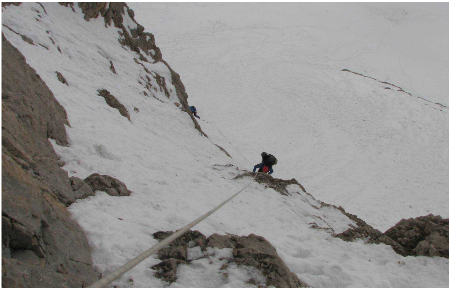
Фото 68. Подъем на перевал Стамбул (2Б), наклонная снежная полка под скальной стеной. Вторая веревка.