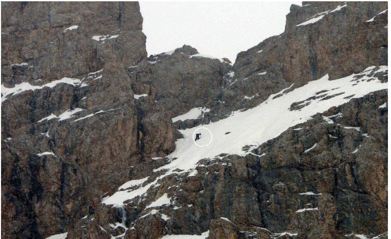
Фото 67. “Обработка” перевалу Стамбул (2Б). Четверта веревка, зум 10X.