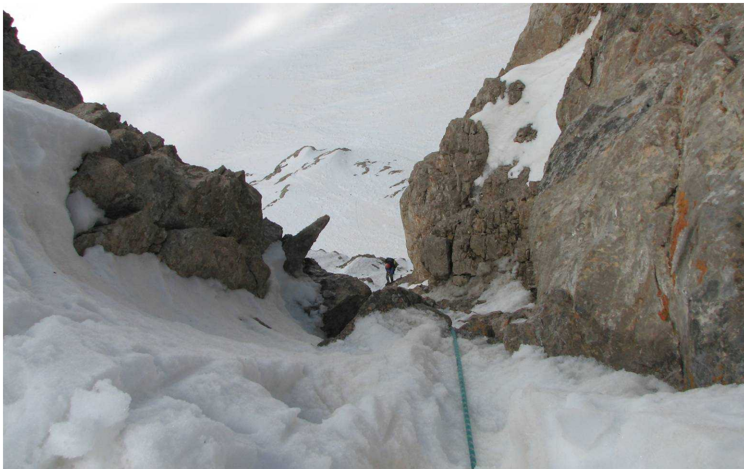
Фото 72. Подъем на перевал Стамбул (2Б). Пятая веревка.