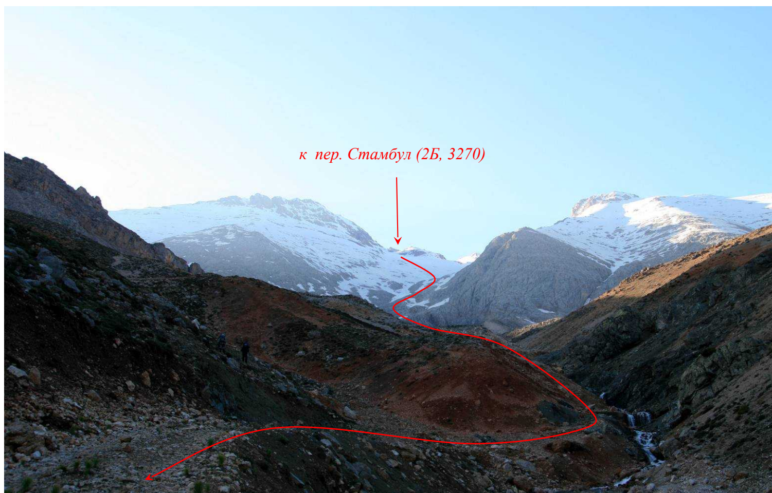
Фото 75. Верховья долины Адсиз.