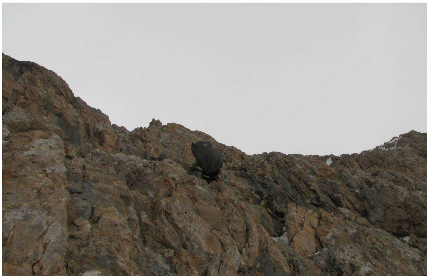
Фото 69. Подъем на перевал Стамбул (2Б). Преодоление скальной стены. Третья веревка.