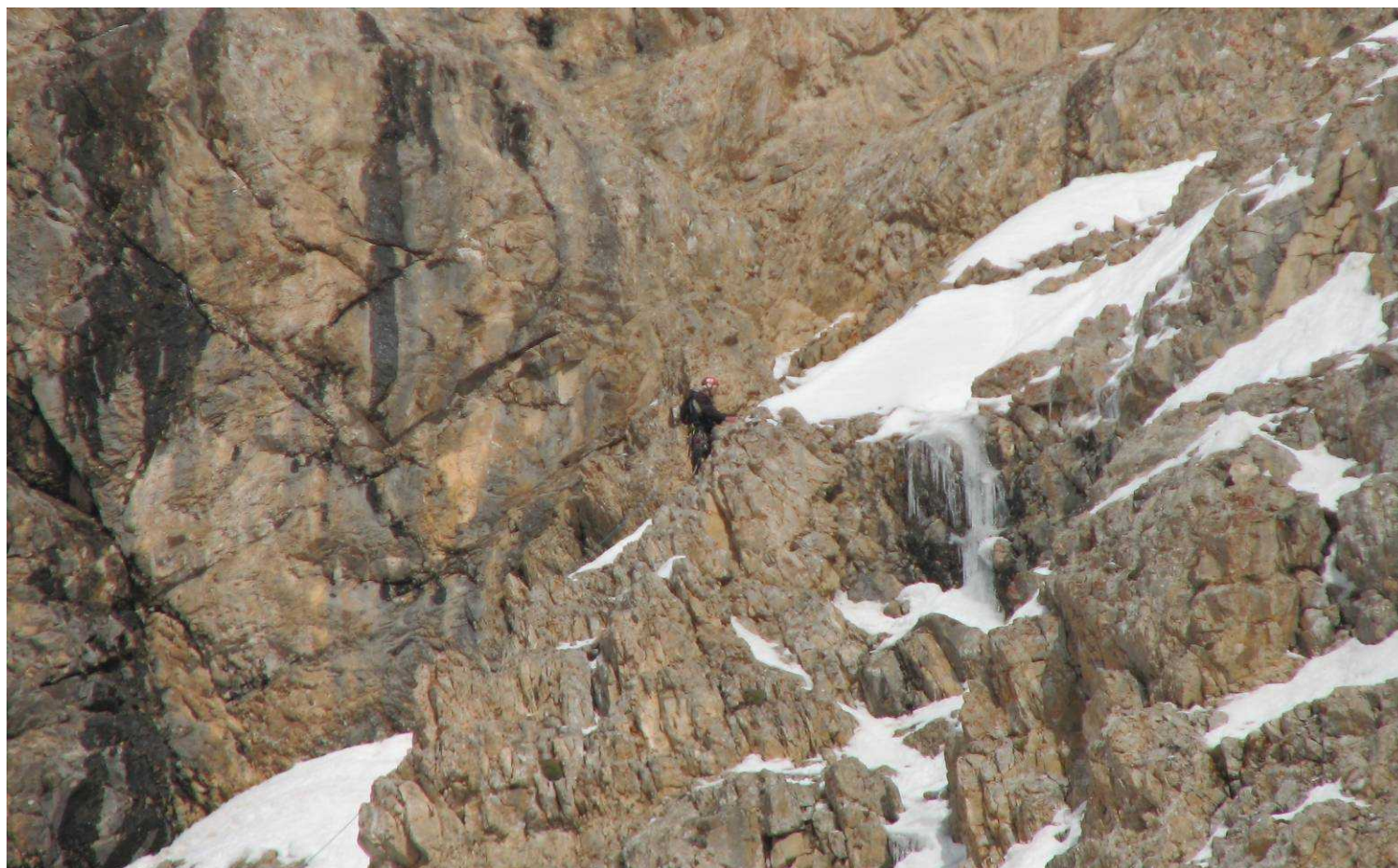
Фото 65. “Обработка” перевалу Стамбул (2Б). Четвертая веревка , зум 10X.