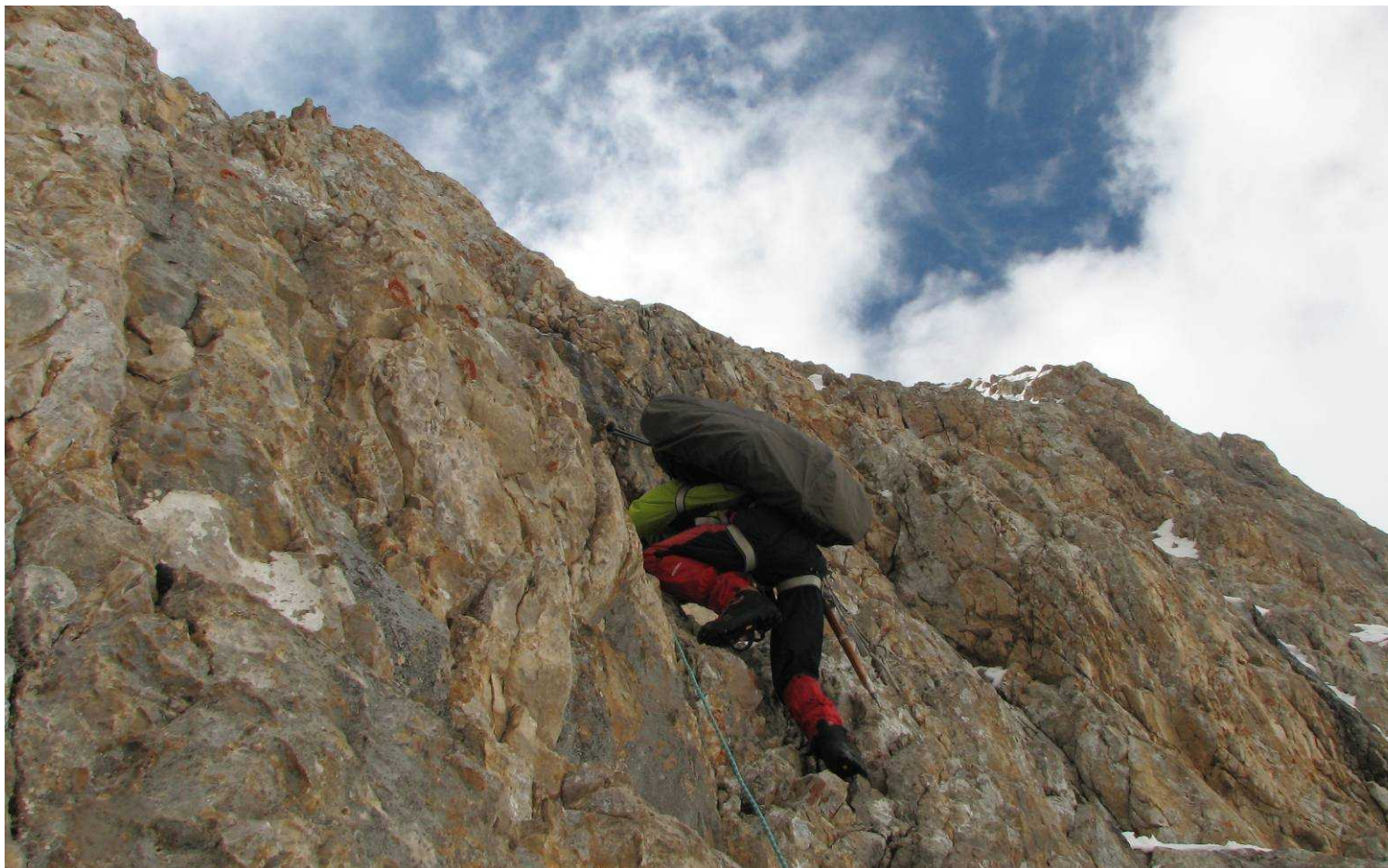
Фото 70. Подъем на перевал Стамбул (2Б). Преодоление скальной стены. Третья веревка.