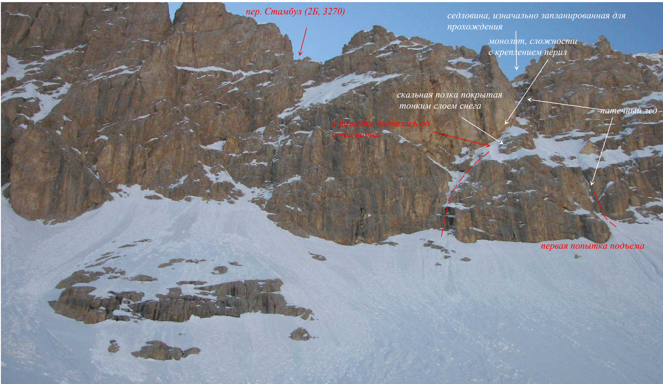
Фото 75. Перевал Стамбул (2Б).