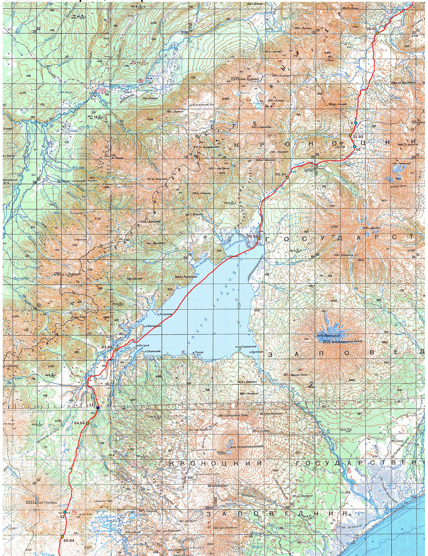
Схема 4. Район Кроноцкого озера.