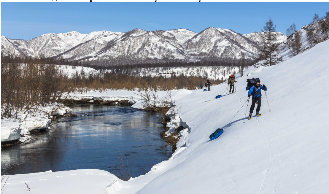
Фото 96. Движение по насту вдоль русла реки Зелёная