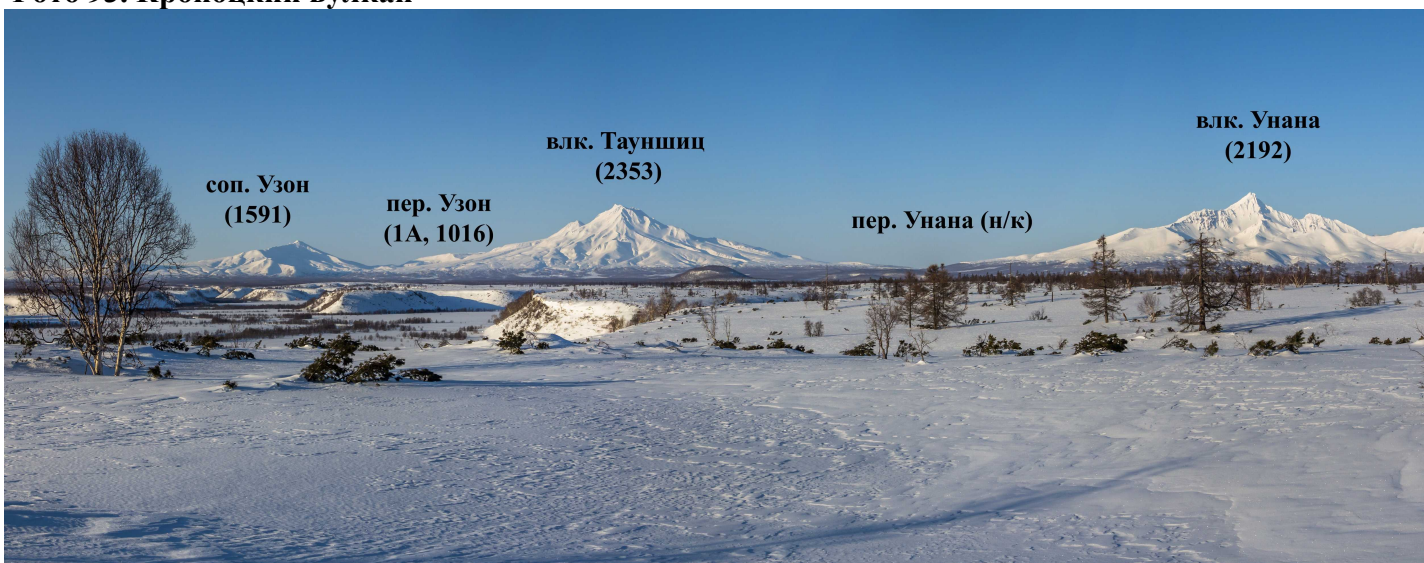
Фото 94. Вид с берега Кроноцкого озера на юг