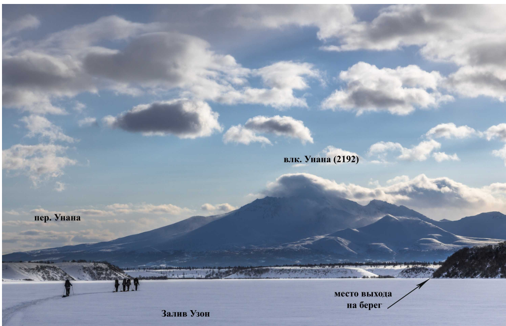
Фото 92. Залив Узон Кроноцкого озера. Вид на юг.