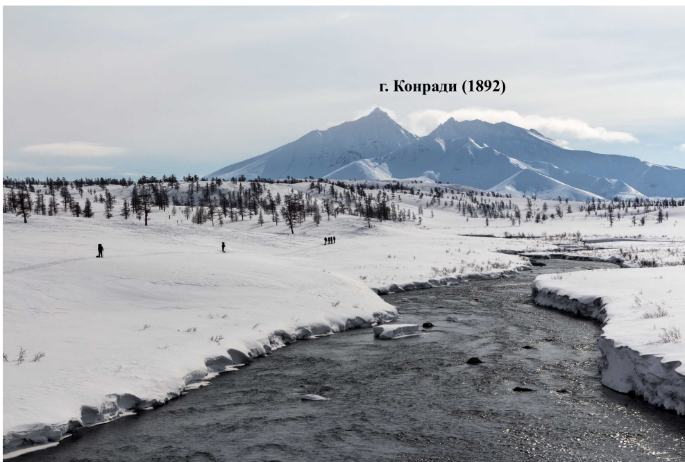
Фото 83. Долина реки Сторож