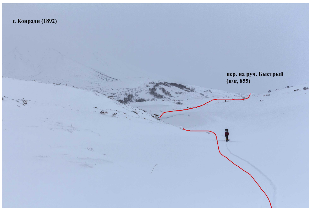
Фото 86. Район истоков ручья Быстрый