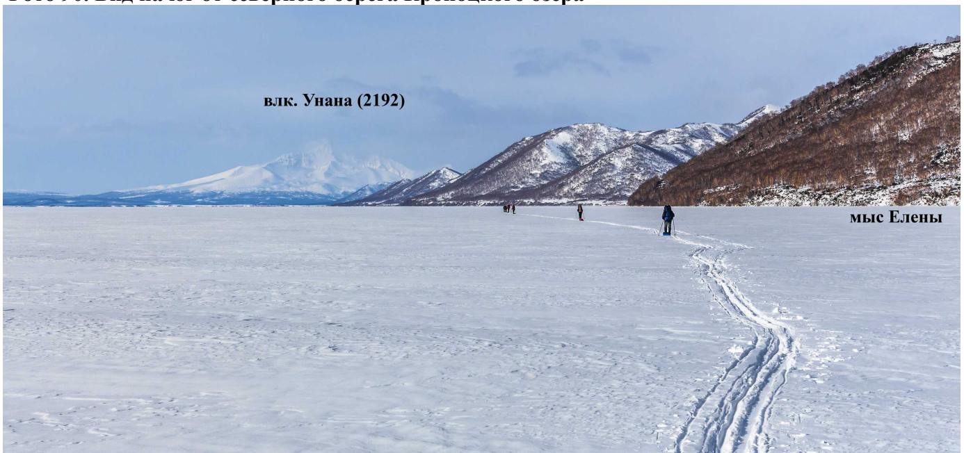
влк. Унана (2192)