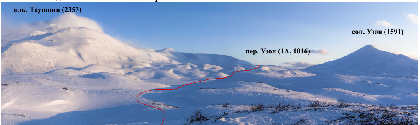
влк. Тауншиц (2353)