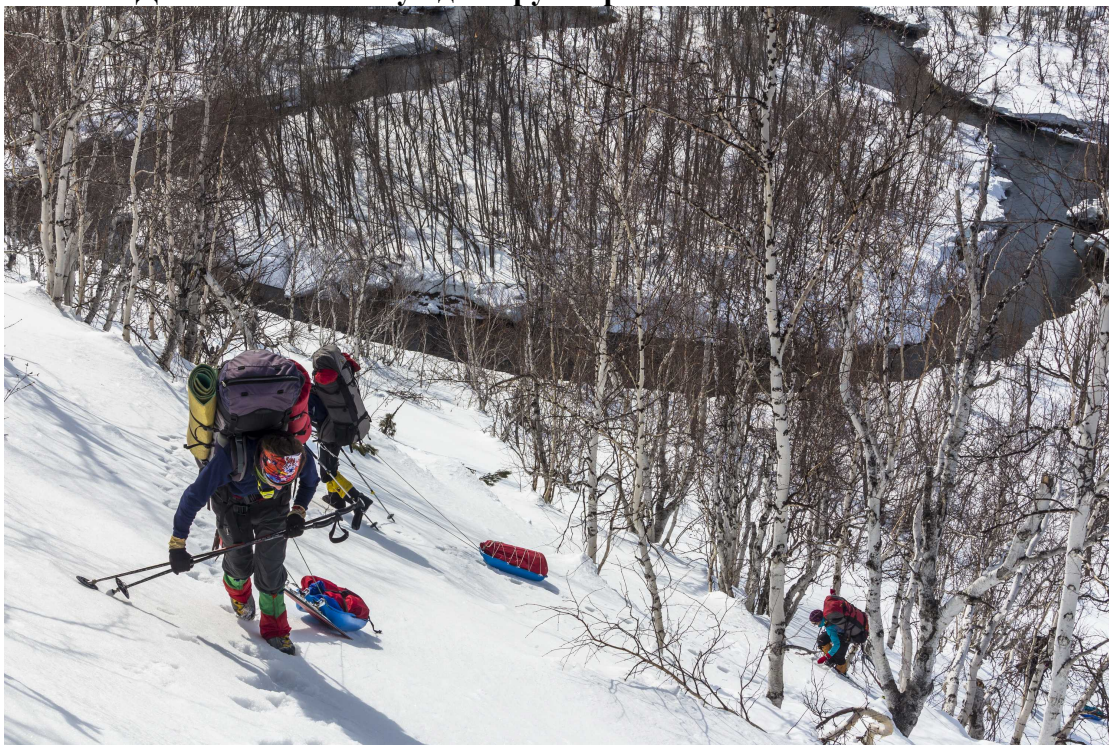
Фото 97. Подъём на правый борт долины реки Зелёная