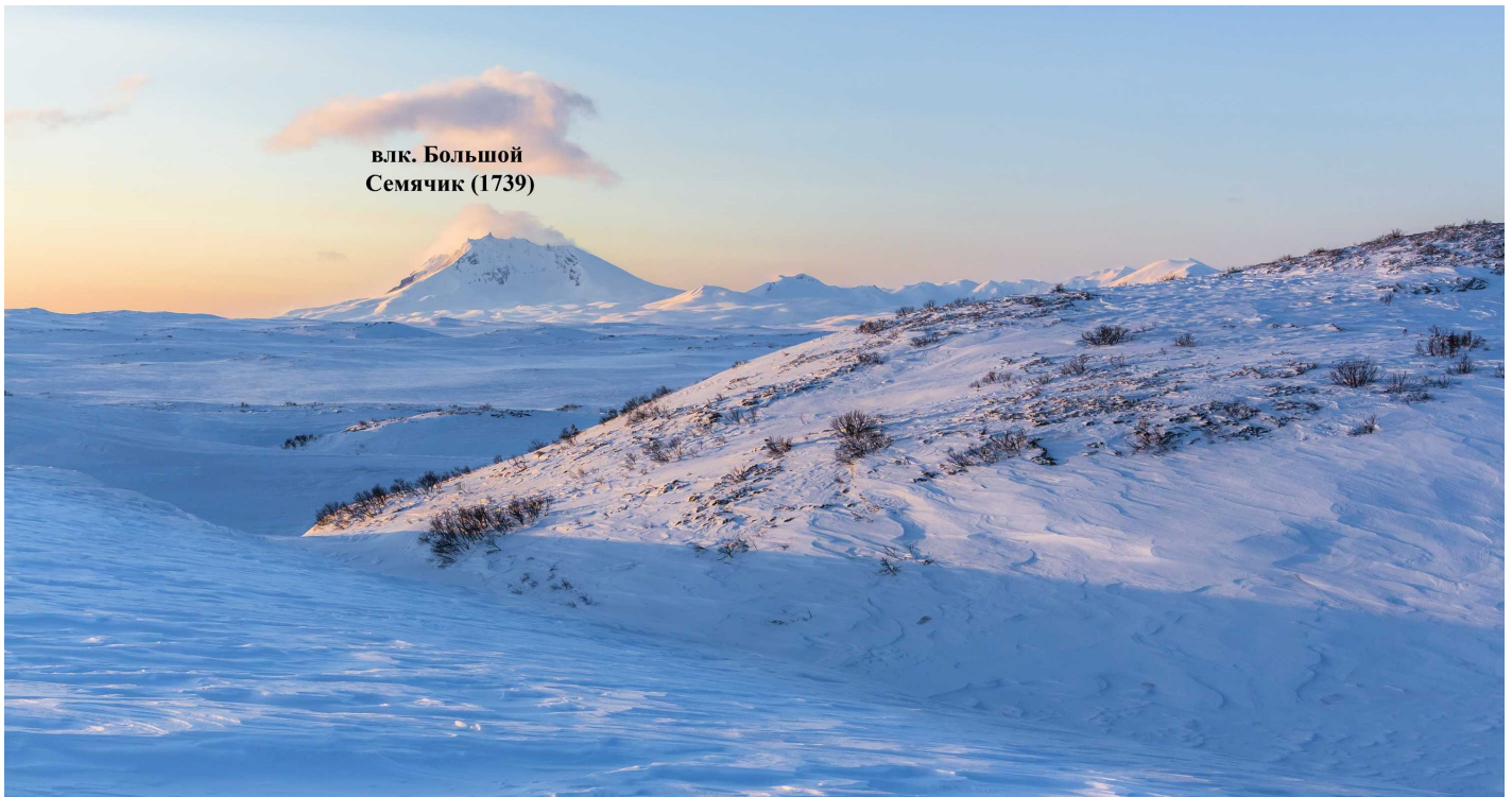
влк. Большой Семячик (1739)