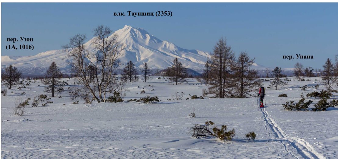
Фото 95. Вид на северные склоны вулкана Тауншиц