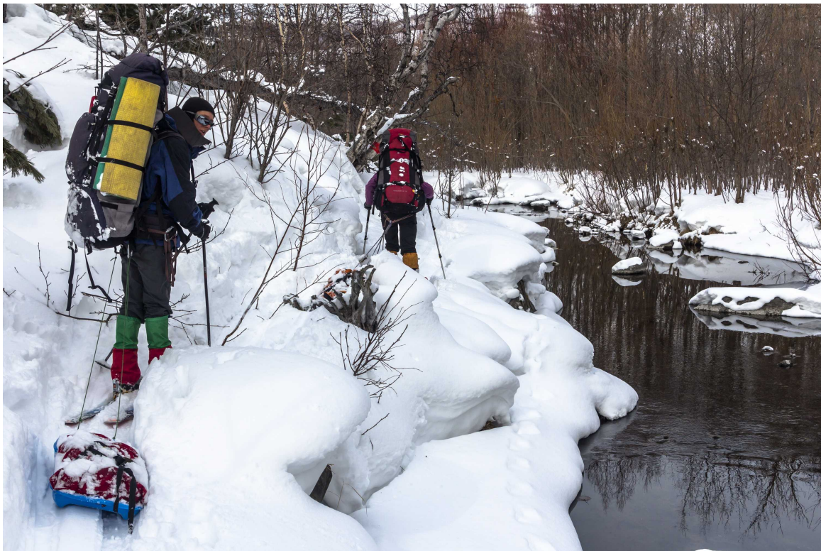
Фото 89. Прижимы на одном из рукавов реки Лиственничная