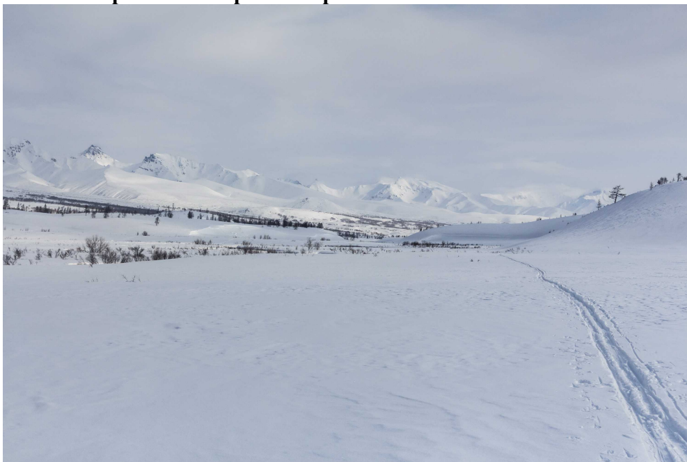
Фото 85. Вид вниз по долине реки Сторож