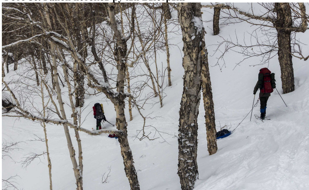
Фото 87. Траверс склонов правого борта ручья Ключевой