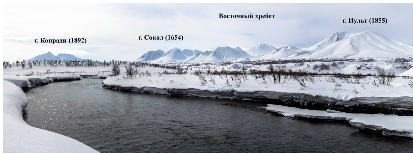
Фото 82. Долина реки Сторож

Спустились с перевала на сотню метров по высоте в сторону плато Синий Дол. Здесь ветровой наст плохо держит, тропим, темп замедлился. На ночёвку остановились в 19:32 в огромной снежной мульде. От обеда 3 перехода, дров нет, готовили на горелках, вода из снега.