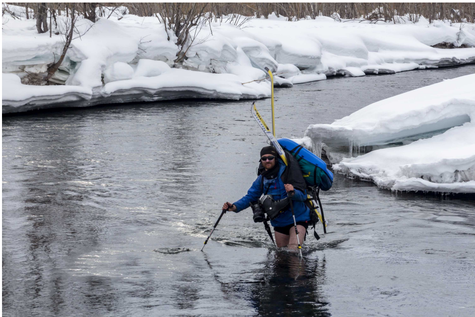
Фото 98. Брод реки Зелёная