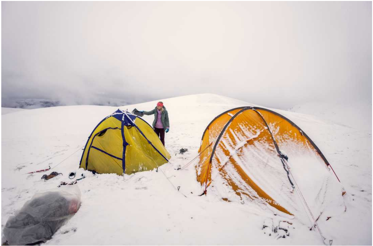
Ф. 20. Встали на стоянку недалеко от вер. Дженту. В предыдущий день снега не было... Вся вода замерзла или была в недостижимости. В связи с перечисленными выше обстоятельствами, было принято решение не делать восхождение на Дженту, а идти сразу и через пер. 2603 и подобраться поближе к Нижнему Дженту и пресной воде.