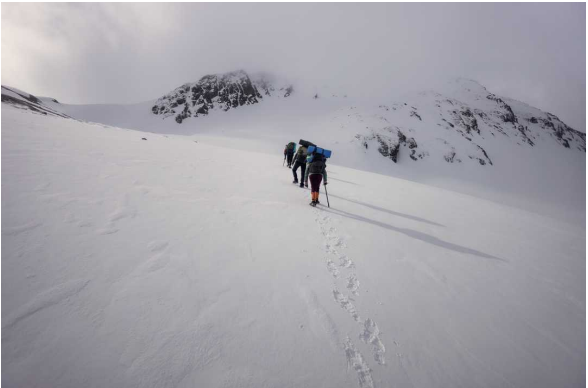
Ф. 15. Взбираемся на перевал