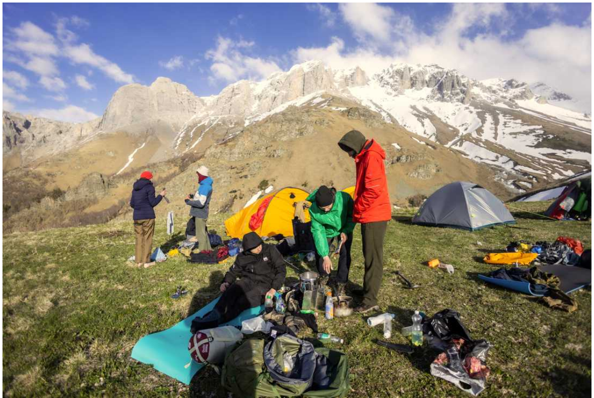
Ф. 12. Наконец пришли на место стоянки третьего дня. Преодолели почти 22 очка. Устали и остаток дня посвятили отдыху.