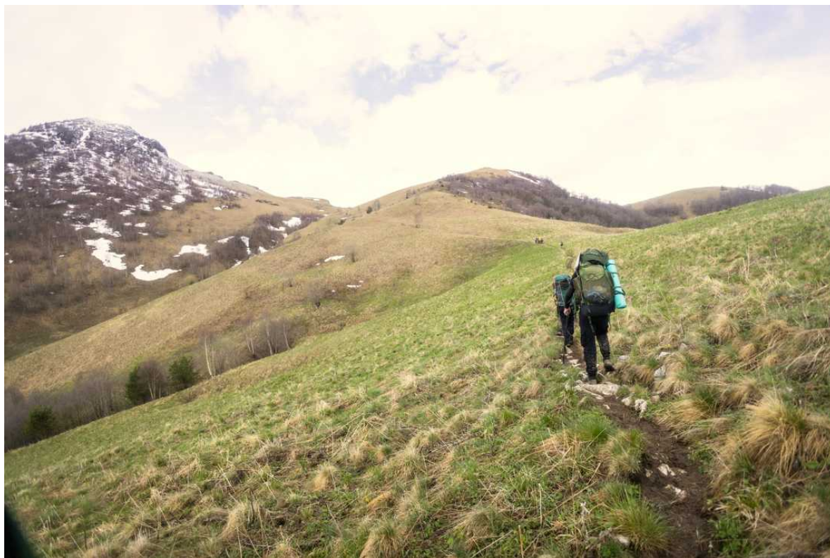
Ф. 8. Наконец погода прояснилась и, к нашему счастью, стало видно горные вершины. Идем в сторону Маркопиджа.