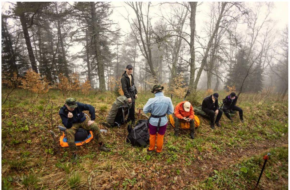
Ф. 5. Группа на привале недалеко в. Хацавита