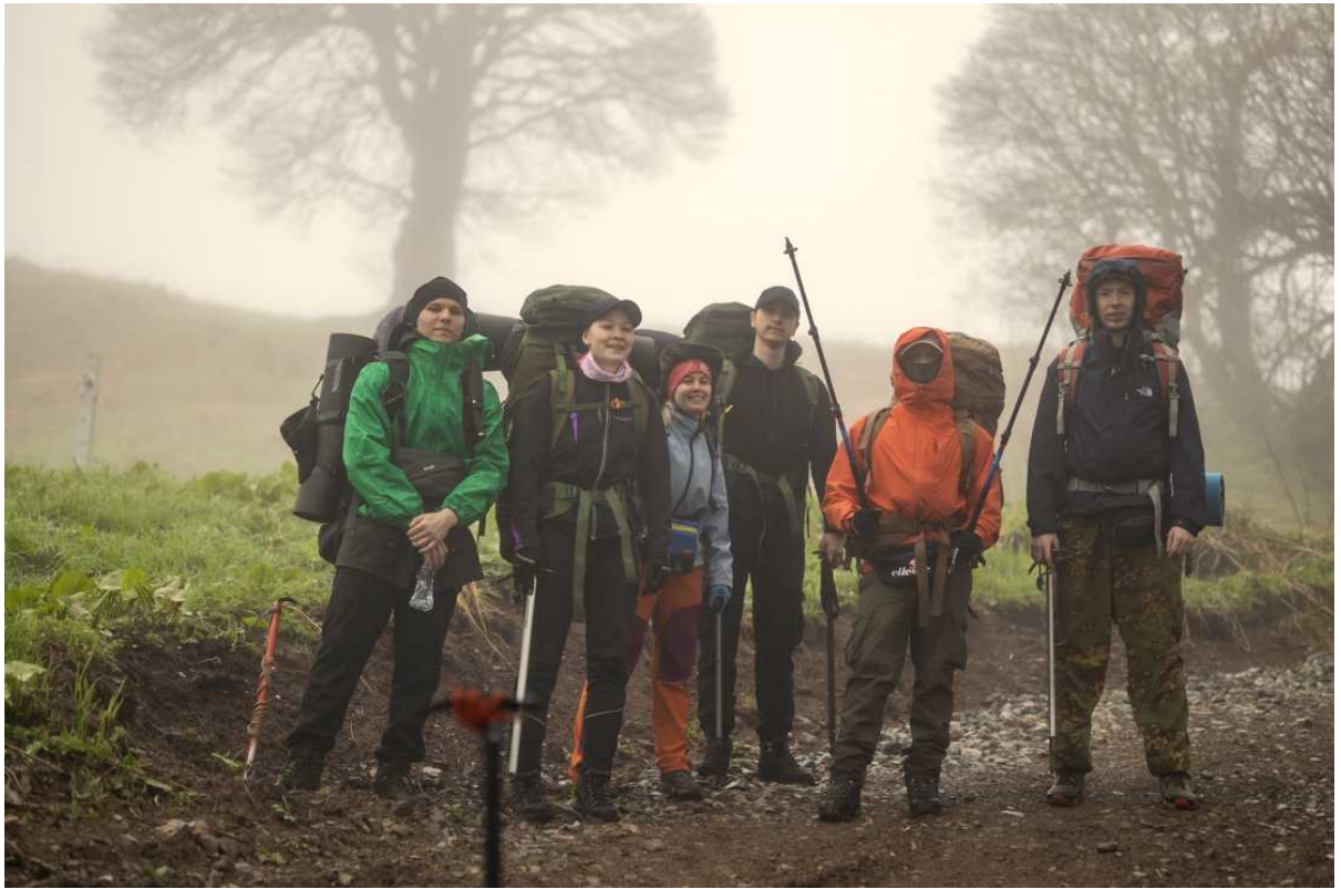
Ф. 4. На следующее утро погода была без особых изменений, моросил дождь и стоял туман. Фото группы перед выходом.