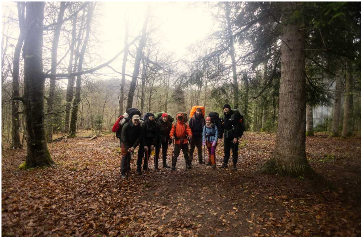
Ф. 7. В предыдущий день удалось немного просушиться у костра. Утром погода была примерно такая же, как прошлые два дня – сырая. Фото команды перед выходом со второго места ночевки.