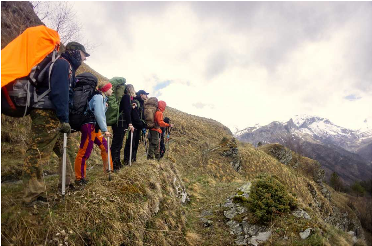
Ф. 10. Двигаемся вниз. Цель – подобраться как можно ближе к перевалу Блыбский.