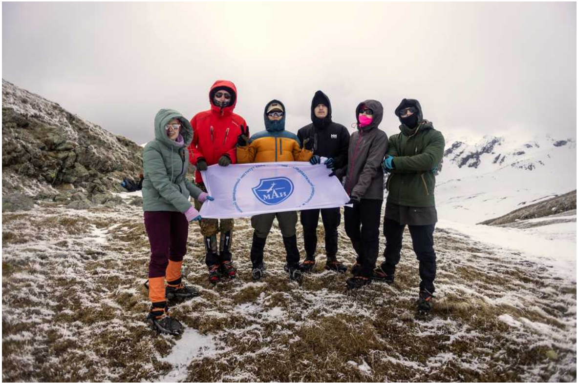
Ф. 18. Команда МАИ на перевале Блыбский(1А), 2568 м. УРА!