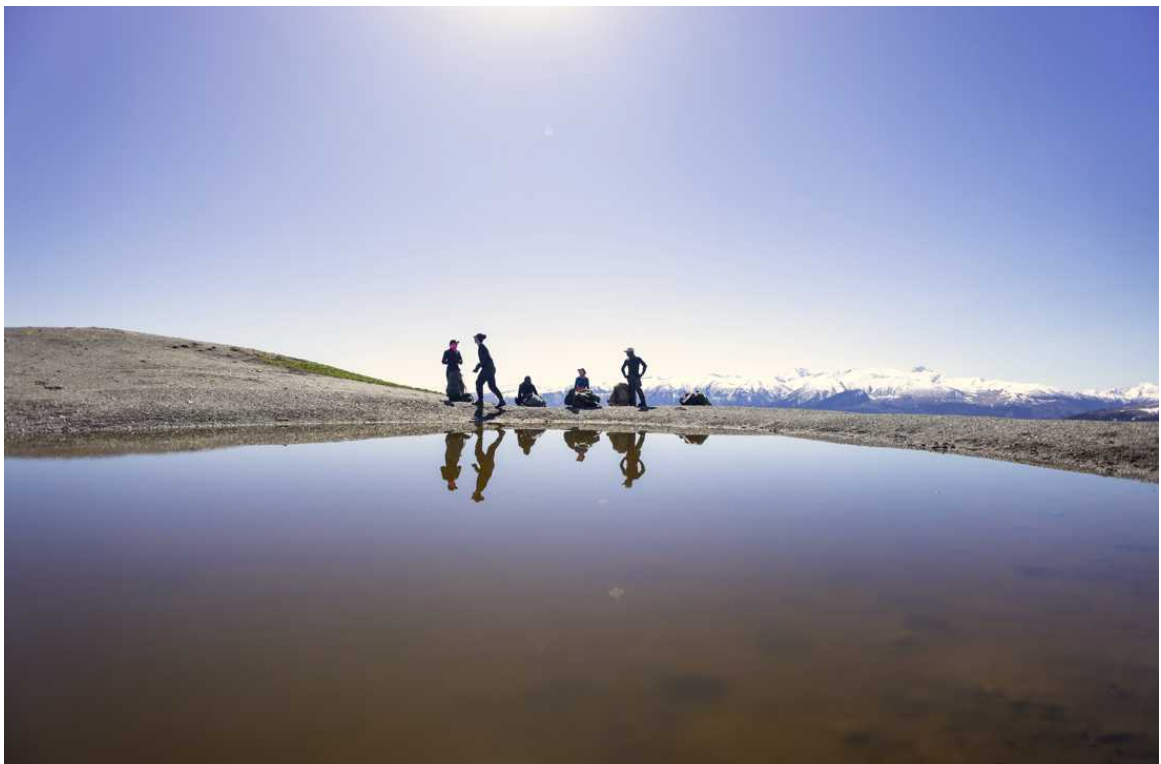
Ф. 23. Можно сказать, последний активный день нашего похода. На фото мы переодеваемся у озерца рядом с Нижним Джентом, готовимся взойти на Большой Пцицер.