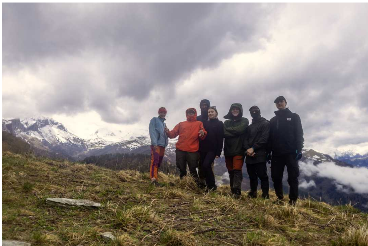
Ф. 9. На привале около в. Маркопидж