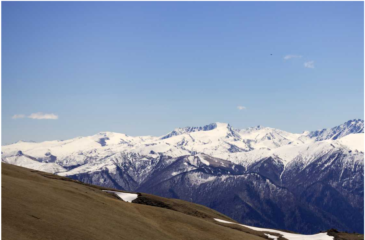
Ф. 24. Вид на пути к вершине. Погода стояла просто отличная.