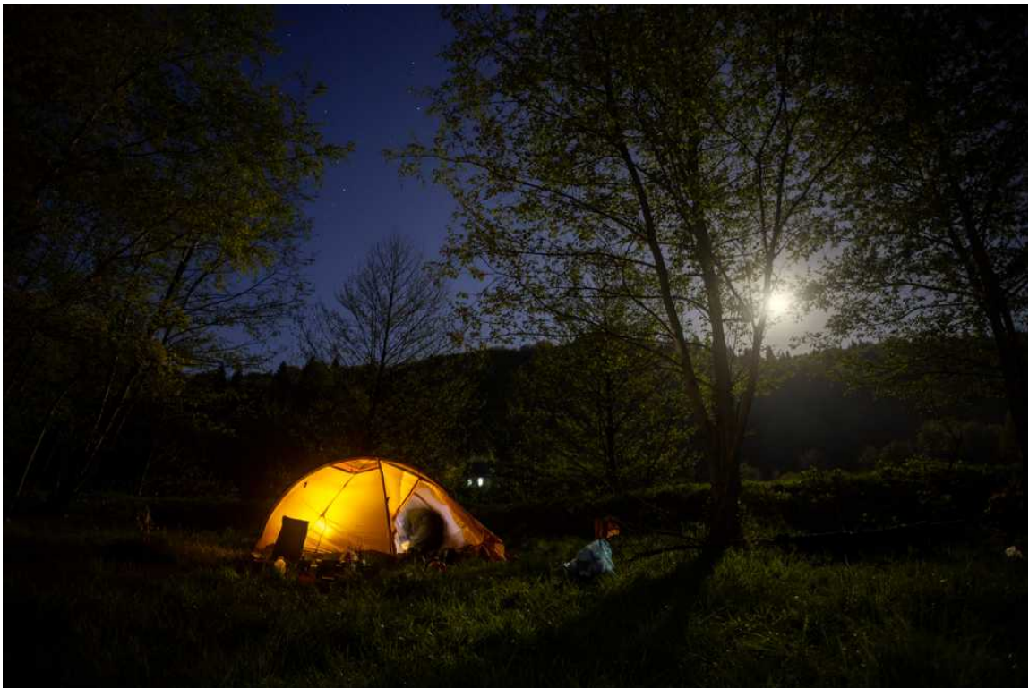
Ф. 27. В Рожкао встали лагерем у заброшенного магазина. Хорошо отдохнули, сходили в баню, вкусно поели. Через день по дороге вышли в Бескес, где наш поход считался завершённым.