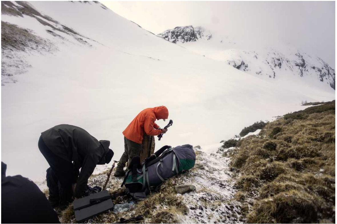
Ф. 14. Следующий день. Готовимся к штурму Блыбского – надеваем кошки и остальное снаряжение.