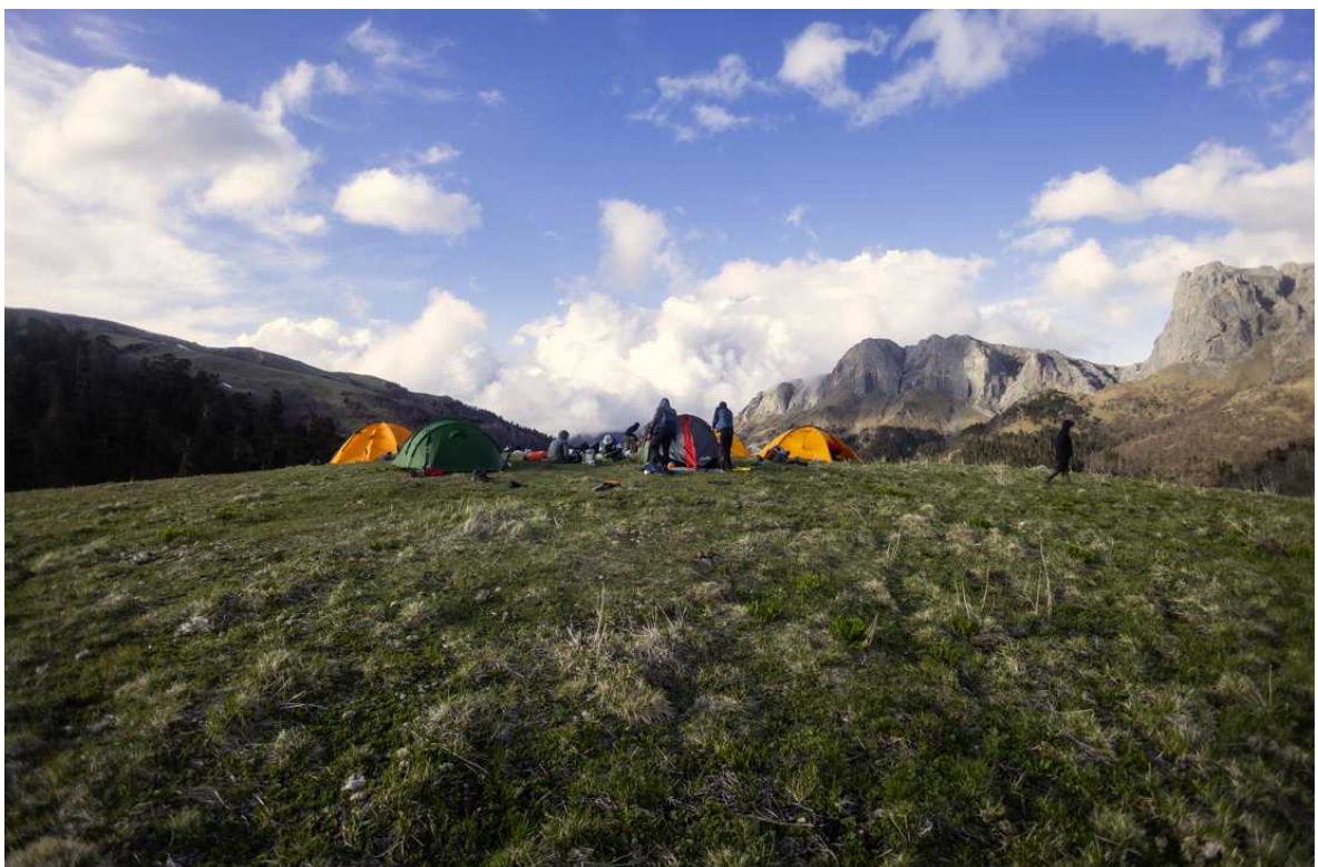
Ф. 13. Поляна нашего лагеря