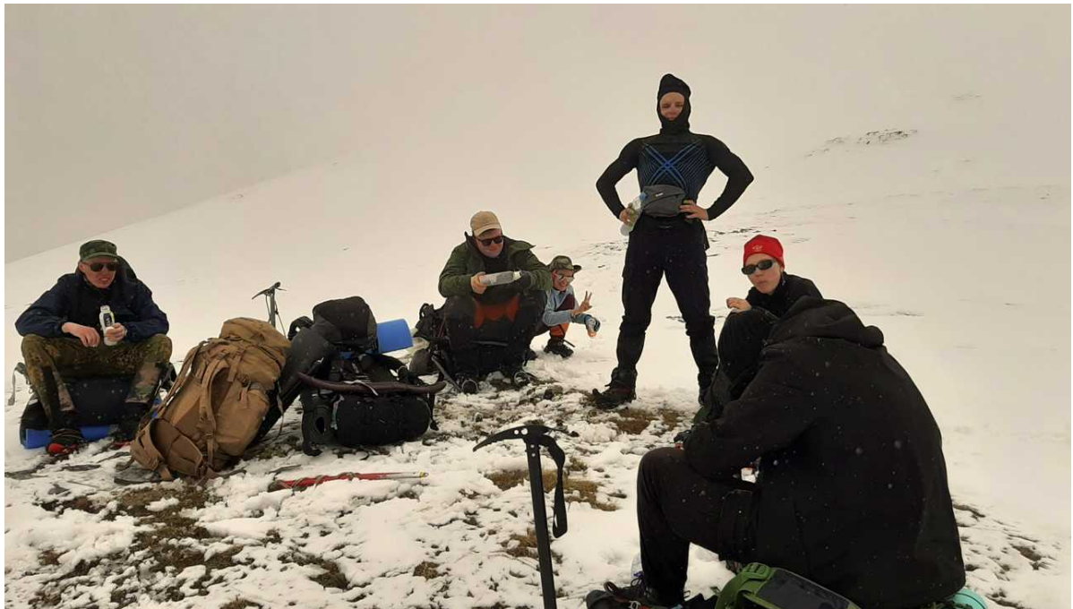
Ф. 21. Команда на пер. 2603(1A). Зашли с использованием кошек и другого специального снаряжения без особых проблем. После прохождения погода ненадолго ухудшилась, поднялся неслабый ветер и пошел снег. Благо это продлилось недолго.