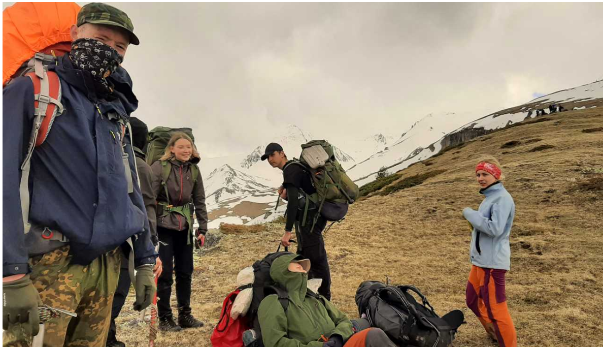
Ф. 11. Перевал 2245 1А