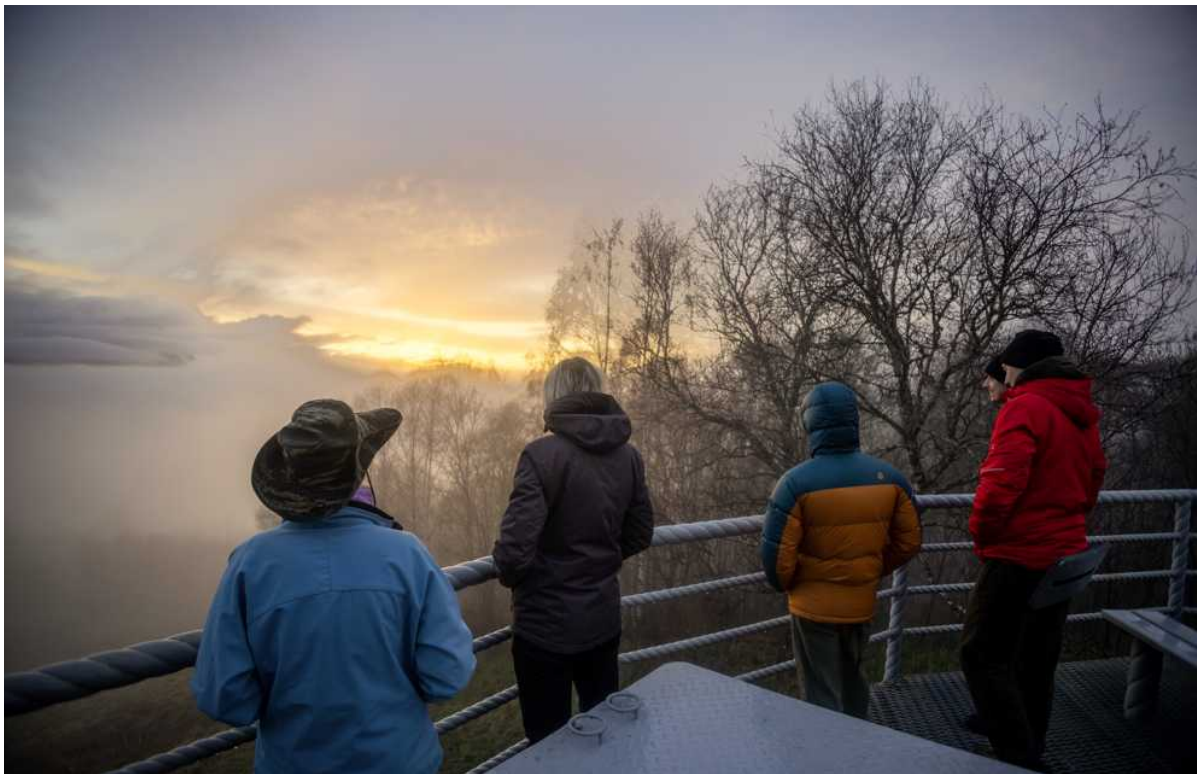
Ф. 3. Администратор местного кафе разрешила нам поужинать внутри. Под вечер туман немного рассеялся и мы наблюдали прекрасный закат