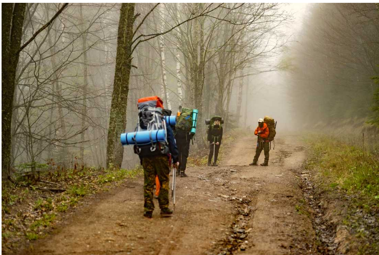
Ф. 1. Трансфер привез нас в Никитино около 4:30 утра. Немного подождали, пока наступит рассвет и двинулись к месту первой ночевки около г. Голая