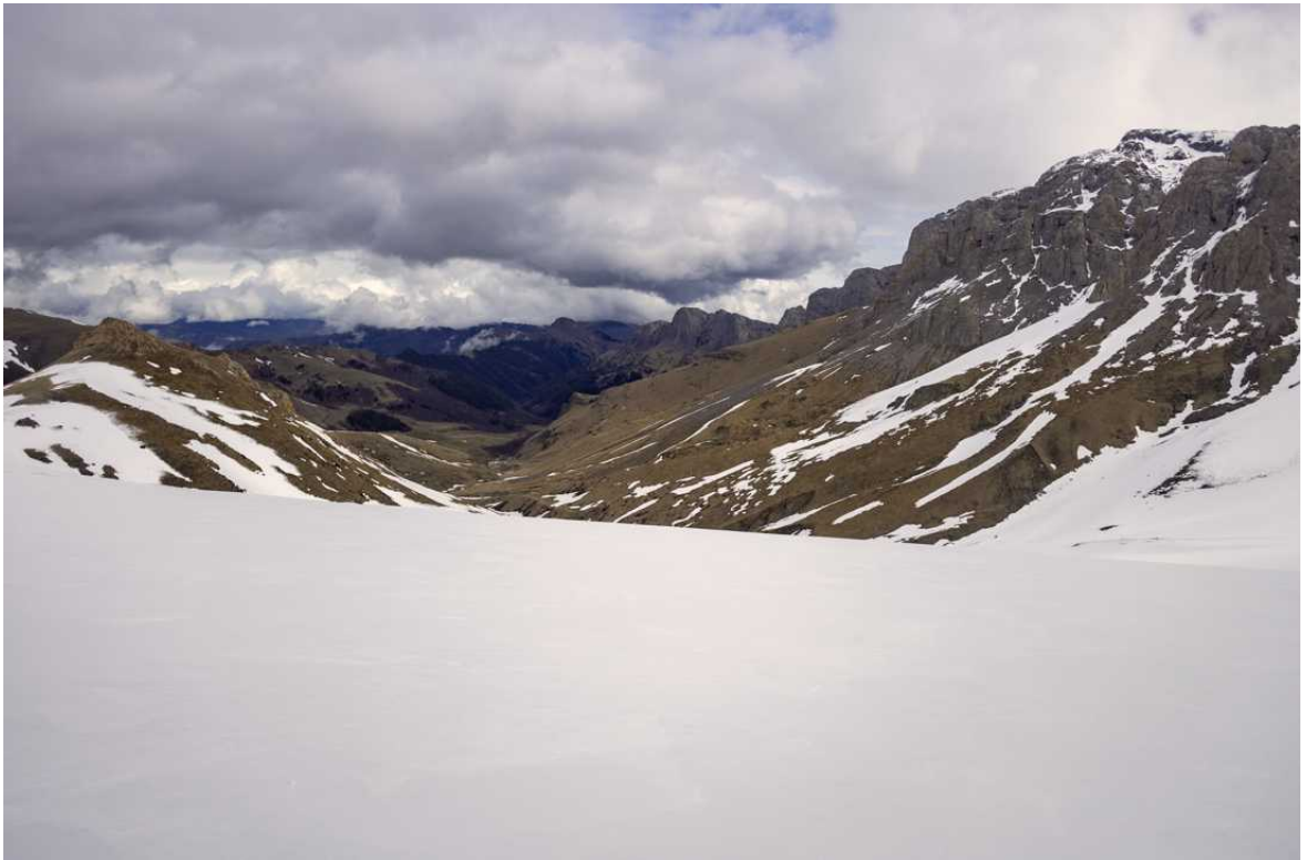
Ф. 16. Вид на подходе к пер. Блыбский