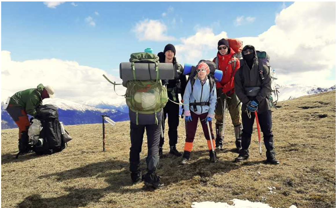
Ф. 19. В этот же день преодолели пер. Белая скала, 2457(1А).