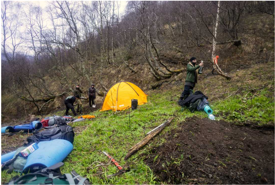
Ф. 22. Группа встала на незапланированном месте ночевки недалеко от Нижнего Джента. Не смотря на не самую ровную площадку, тут есть пресная вода - нам не придется опять топить снег.