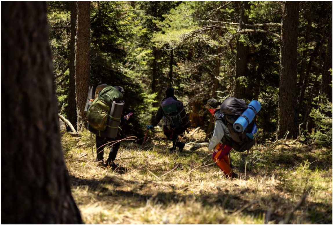
Ф. 26. Так выглядел наш последующий спуск до дороги в Рожкао