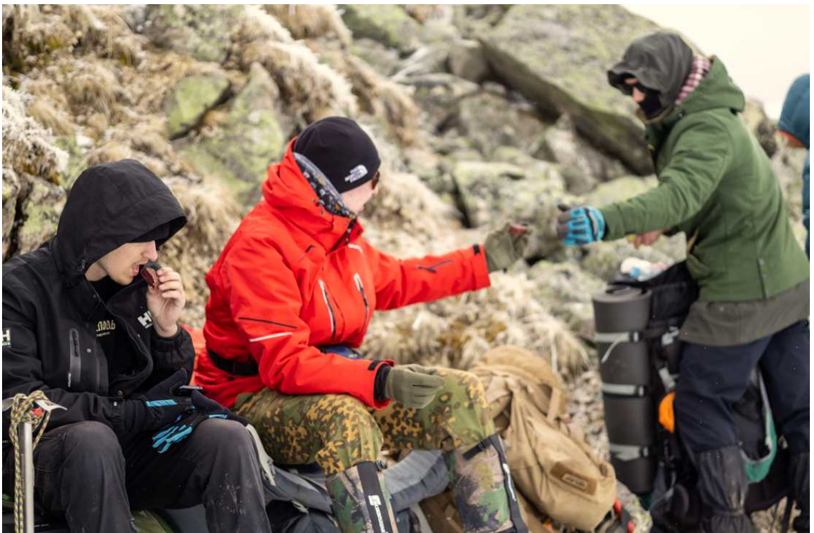
Ф. 17. Взобравшись на перевал, команда заслужила долгожданный перекус.