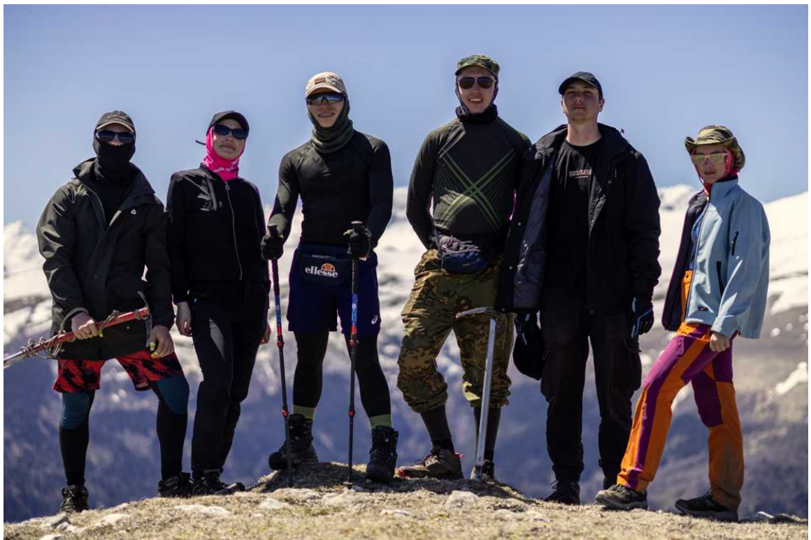
Ф. 25. Группа на вершине Большой Пцицер. Перекусили, поймали связь и созвонились с родными.