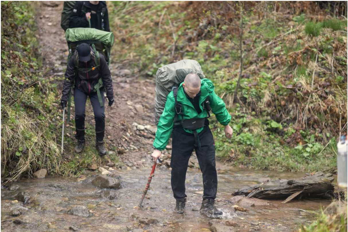
Ф. 6. Микроброд перед вторым местом ночевки